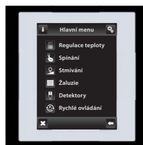
černá / bílá