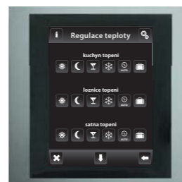
hliník / tm.šedá