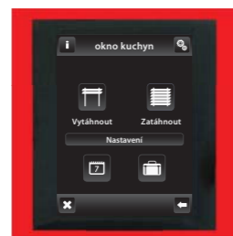
červená / hliníková