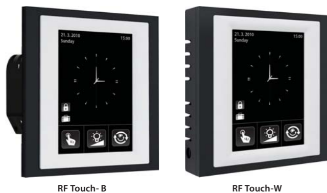
RF Touch- B