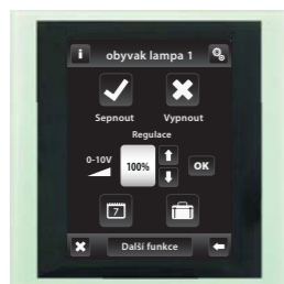
sklo / šedá