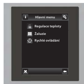
chrom / šedá