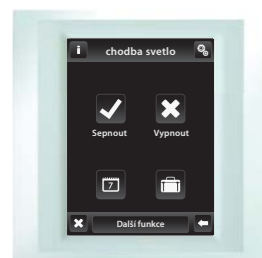
bílá / perleťová

** Hmotnost je uvedena s plastovým rámečkem a mezirámečkem.