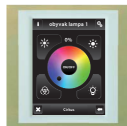
titan / ledová