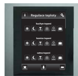
hliník / tm.šedá