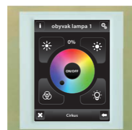
titan / ledová