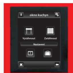
červená / hliníková