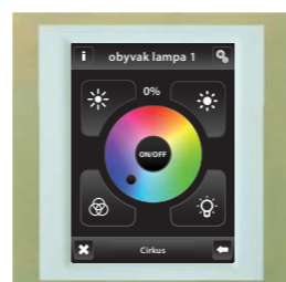
titan / ledová