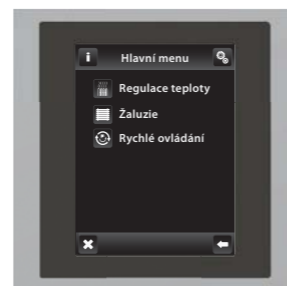
chrom / šedá