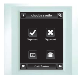
bílá / perletová