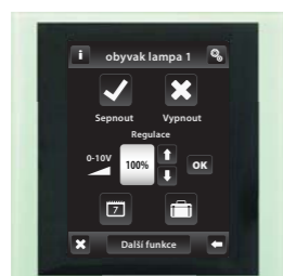
sklo / šedá