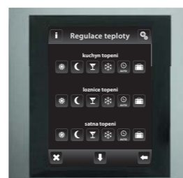
hliník / tm.šedá