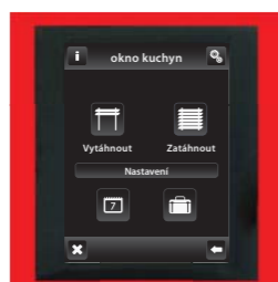
červená / hliníková